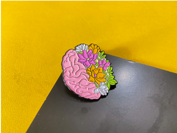
Bilişsel Esneklik Rozeti

Sonra aynı durumu bilişsel esneklik rozetini taktığında nasıl olurdu şeklinde konuşarak pekiştirmesini sağlayın.